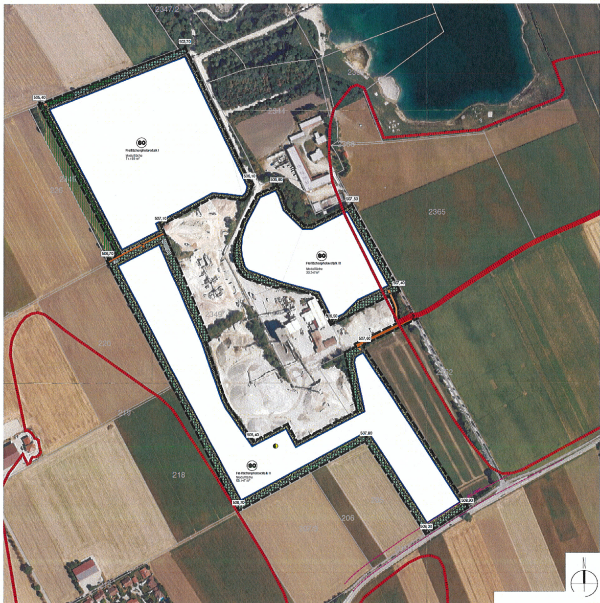
Umgriff des vorhabenbezogenen Bebauungsplanes „Sondergebiet Freiflächenphotovoltaik-Anlage Gerharding“ (ohne Maßstab)

Der Planbereich liegt nördlich der Staatsstraße 2082 am westlichen Rand des Gemeindegebietes, und umfasst die Grundstücke Fl.Nrn. 2349/Teilfläche, 2349/9/Teilfläche, 2349/4/Teilfläche und 2352/Teilfläche Gemarkung Pliening. Der Umgriff ist im beigefügten Lageplan dargestellt.